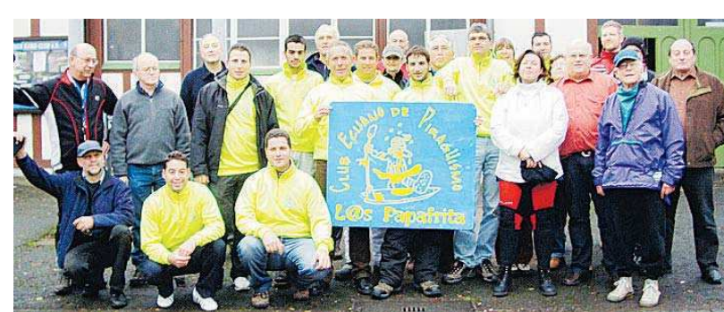
Die Kanuten aus Andalusien und Saarbrücken.

Die Nikolausfahrt wird traditionell vom Saarländischen Kanu-Bund organisiert, an dem alle saarländischen Kanuvereine mit ihren Vereinsmitgliedern teilnehmen können. red